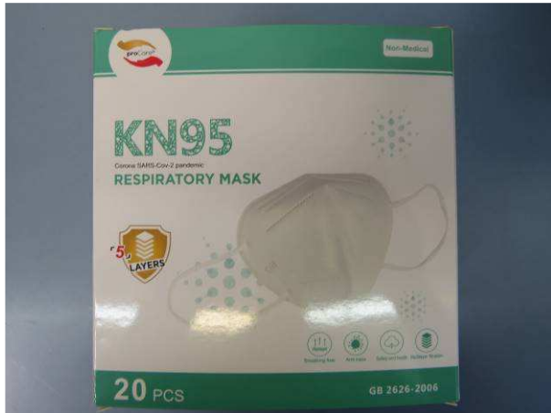
Bild 1 Verpackung der Probekörper