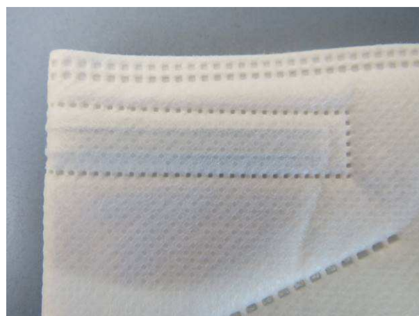
Bild 6 Detail Nasenbügel