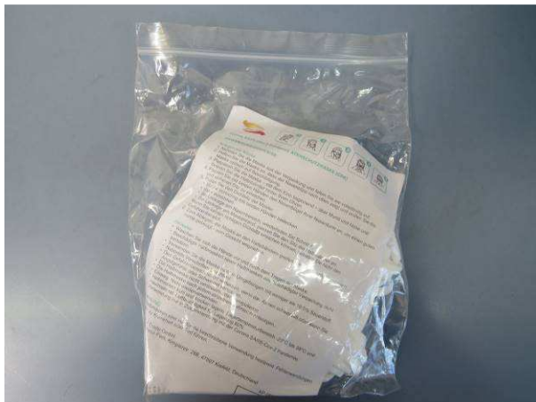
Bild 3 Einzelverpackung