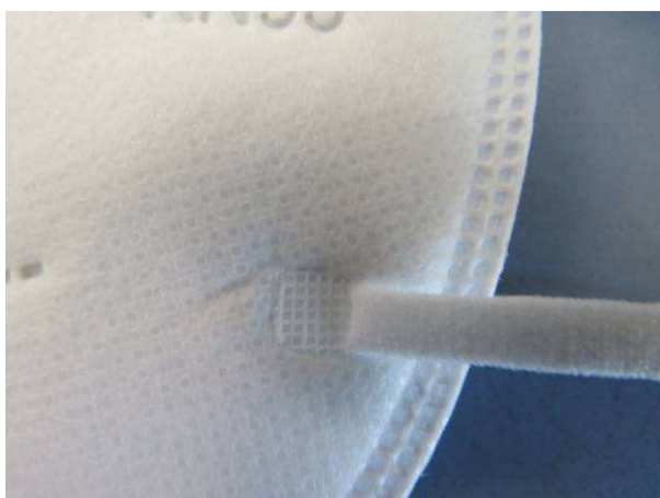
Bild 5 Anbindung der Kopfbänderung