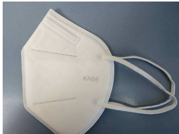
Bild 4 Ansicht des Probekörpers